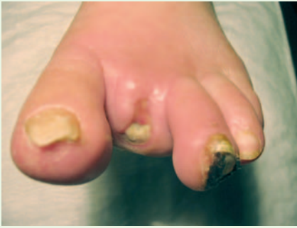
20.10.2005 - Scleroderma al termine del terzo ciclo (3 mesi) di antibiotico-terapia mirata.